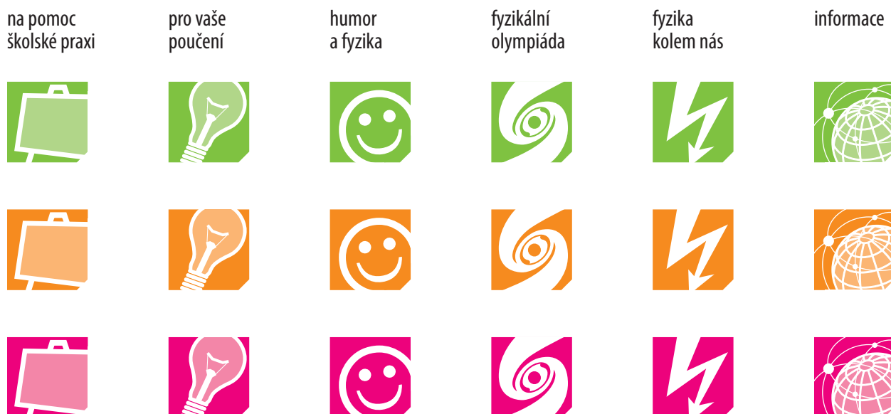
Obr. 4 – Orientační systém nové podoby časopisu

Tak jako dosud budeme zachovávat systém barevného označení článků podle toho, kterým učitelům bude příslušný článek přednostně určen. Barvy se ale změní: zeleně budou označeny články pro všechny čtenáře, oranžově pro ZŠ a purpurově (červeně) pro SŠ. Články budou navíc označeny následujícími ikonkami: