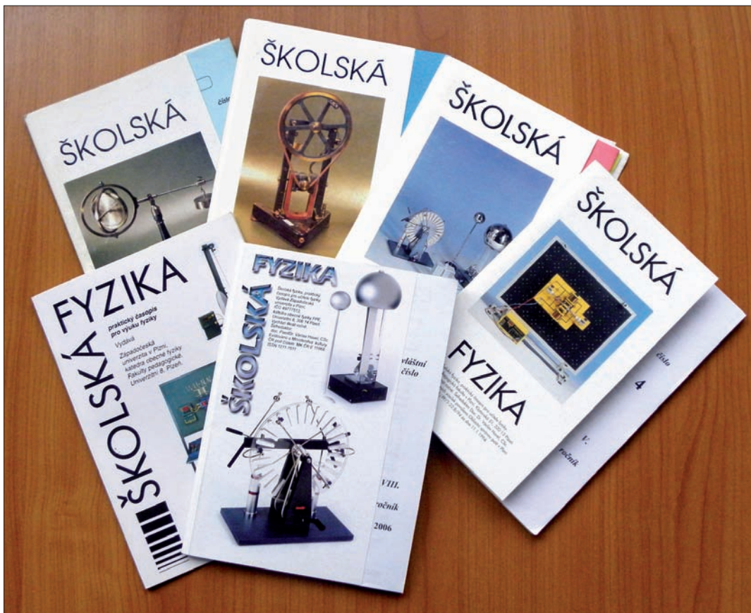
Obr. 1 – Obálky prvních ročníků časopisu školská fyzika

Školská fyzika začala vycházet ve školním roce 1993/1994 jako regionální časopis určený učitelům fyziky v regionu západních Čech. Při jejím vzniku jsme chtěli poskytovat aktuální informace o fyzikálních novinkách, předávat další potřebné informace z fyziky i didaktiky fyziky a zároveň vytvořit prostor pro vzájemnou výměnu informací mezi jednotlivými učiteli. Naším dalším záměrem bylo vytvořit prostředí, které by umožnilo komunikaci mezi výrobci fyzikálních pomůcek či pořadateli zajímavých akcí a učiteli fyziky.