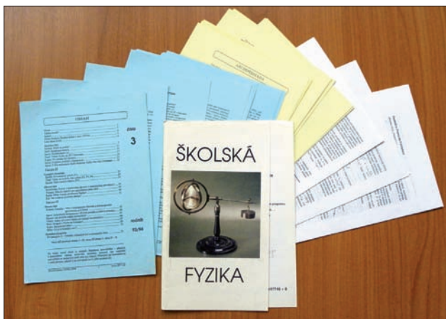
Obr. 2 – Časopis v původní podobě volných barevných listů

Kromě výše uvedených činností jsme vedli evidenci odběratelů, vystavovali faktury předplatného a samozřejmě psali a recenzovali články. Vše zdarma, předplatné sloužilo k úhradám tisku, poštovního a potřebného materiálu. Desky nám poskytovala formou sponzorského daru firma Didaktik. Velmi brzy se začal rozrůstat okruh čtenářů i mimo západní Čechy, stejně intenzivně rostl počet autorů a dalších spolupracovníků, byli jsme podporováni Jednotou českých matematiků a fyziků. V maximu jsme měli 1500 odběratelů. V té době už časopis tvořily tři svázané sešity se stejnými barvami papíru, jaké měly původní volné listy, kompletace pak byla mnohem jednodušší.