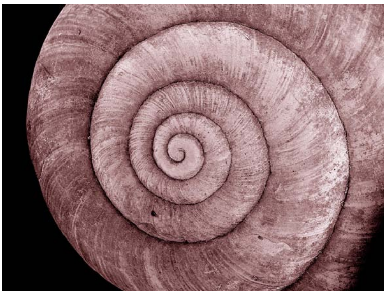
Obr. 2 – spirální struktura šnečí ulity (ilustrační snímek) 3

Ilustrační obrázky byly k článku doplněny redakcí.