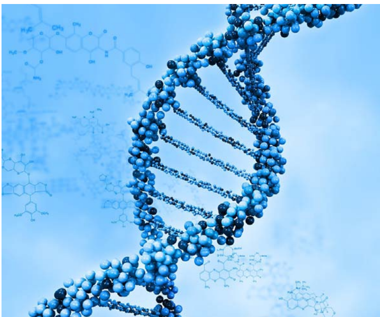
Obr. 3 – spirální struktura DNA (ilustrační kresba) 4