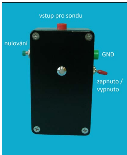
Obr. 1 – elektronický elektroskop (GND – zemní svorka)

První skupinu tvoří experimenty týkající se elektrického náboje. Jedná se hlavně o vznik a přenos