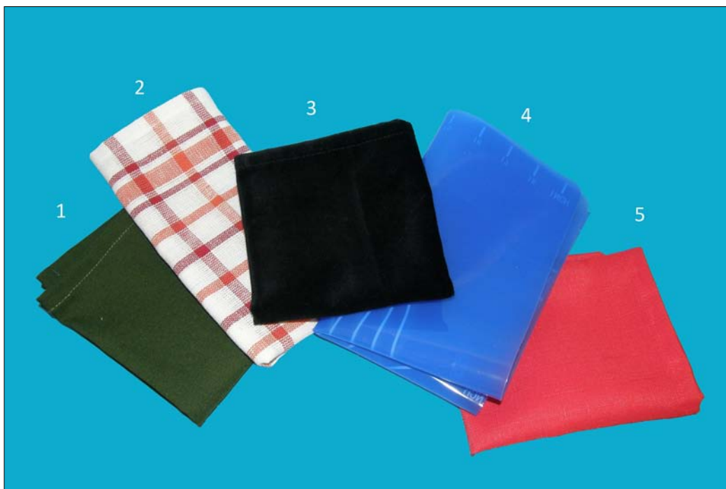
Obr. 4 – látky 1 streč, 2 bavlna, 3 samet, 4 silikon, 5 polyester

učiteli doporučeno využít sadu k demonstraci nebo pro samostatnou experimentální činnost žáka. Pro skupinovou práci učitelé sadu příliš nedoporučovali. Jako důvod uváděli především obtížnější provedení experimentů pro skupinu žáků – výsledky pak nevycházejí dle předpokladů. Dalším důvodem pro nevhodnost pokusné sady při využití pro skupinovou práci žáků byla přítomnost sond. Mohlo by dojít k jejich poškození. V případě sondy s hrotem by pak mohlo dojít i ke zranění žáků.