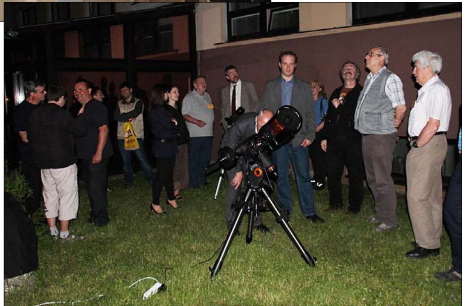
Obr. 5 – Nočné pozorovanie oblohy