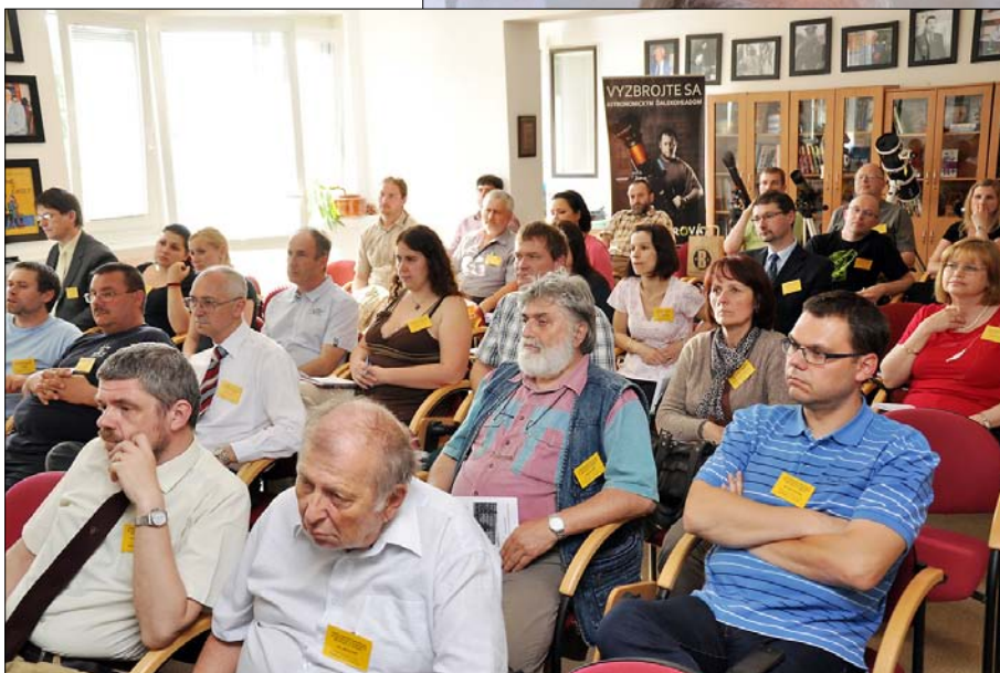
Obr. 3 – Pohľad na účastníkov konferencie