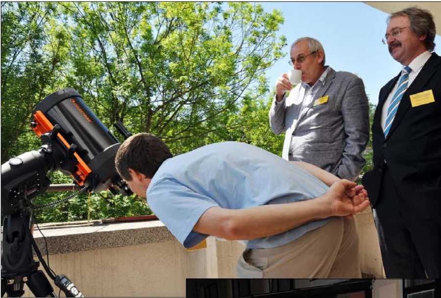
Obr. 4 – Denné pozorovanie oblohy