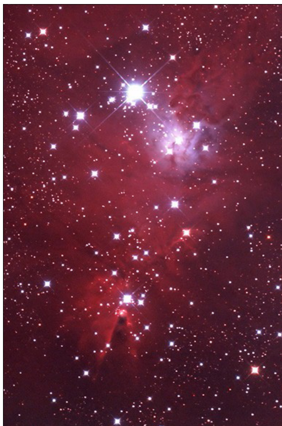
Obr. 4 – amatérská astrofotografie oblasti NGC 2264 pořízená dalekohledem typu Newton s průměrem primárního zrcadla 18,5 centimetrů; autor: Martin Myslivec; http://foto.astronomy.cz/NGC2264_Cone_detail_hi_res.htm

působení tlaku vyvržených částic a fotonů slunečního záření. Projevem slunečního větru jsou rovněž známé polární záře, které můžeme s trochou štěstí pozorovat i z českých zeměpisných šířek.