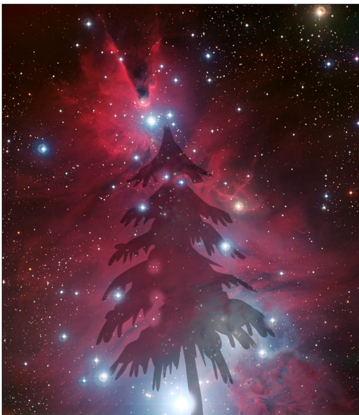
Obr. 2 – rozložení hvězd rozhodlo o pojmenování této hvězdokupy

Nejenom na zobrazené části rozsáhlého oblaku molekulárního plynu, ale v celém jeho objemu neustále dochází ke vzniku nových generací hvězd. Mezi nejaktivnější oblasti patří okolí hvězdy S Mon a okolí další jasné hvězdy na vrcholu Kužele. Přestože jsou hvězdné jesličky na snímku obtížně pozorovatelné, vychází z těchto oblastí silný hvězdný vítr, jehož vliv na okolní hmotu je dobře patrný. Fotony a také plyn vyvrhovaný z rodičích se hvězd doslova tlačí na okolní prachoplynná oblaka a (de)formuje jejich podobu. Podobný jev známe i u našeho Slunce. Ohon komet je slunečním větrem stáčen vždy ve směru od Slunce v důsledku