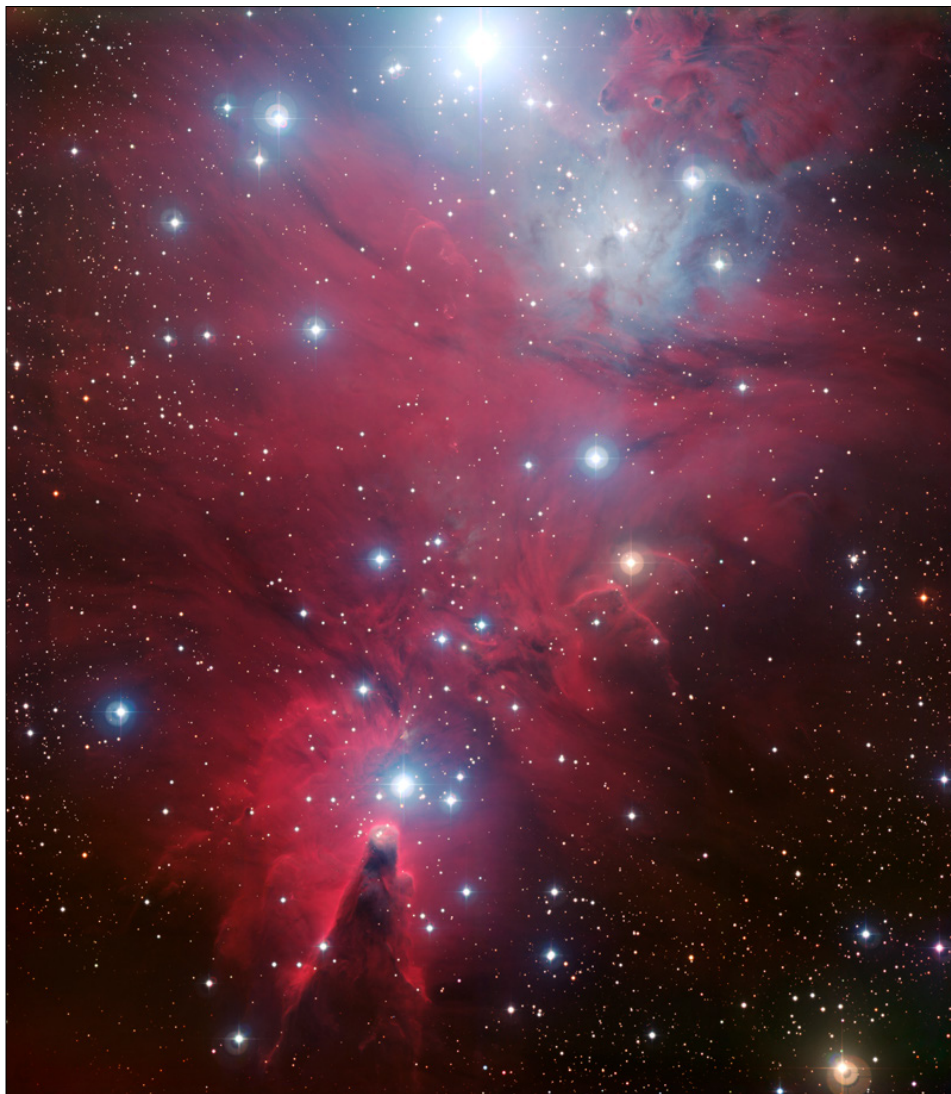
Obr. 1 – snímek NGC 2264 pořízený na Evropské jižní observatoři pomocí dalekohledu s průměrem objektivu 2,2 metry; http://www.eso.org/public/outreach/press-rel/pr-2008/phot-48-08.html

NGC 2264 je od Země vzdálena okolo 2 600 světelných let. V astronomickém měřítku je to velice blízko, nicméně naše představivost se s takovou vzdáleností dokáže vypořádat jen velice obtížně. Samozřejmě pouze pokud vynaložíme to úsilí a pokusíme si 2 600 světelných let představit. Ono totiž i na naši nejbližší hvězdu – Slunce, vzdálenou 8 světelných minut, bychom na kole cestovali celých 20 lidských životů. A to pouze za před-